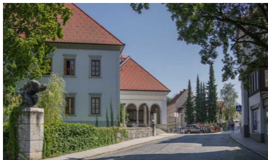
Figure 16 Na vratih - Ljubljanska vrata