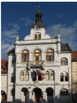
Figure 5 rotovž