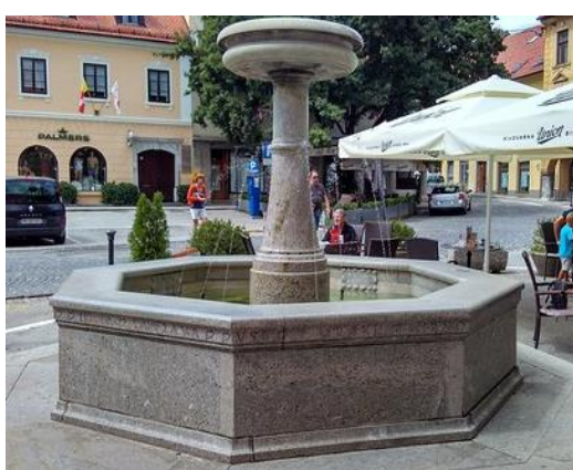
Figure 6 Kettejev vodnjak