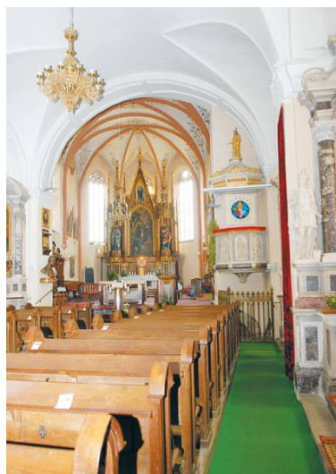
Figure 14 Notranjost cerkve