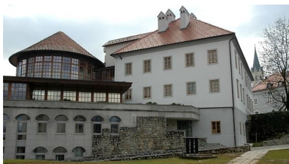
Figure 15 knjižnica Mirana Jarca