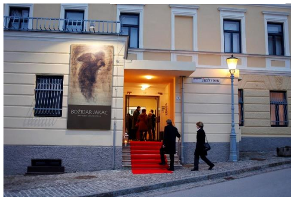
Figure 10 Jakčev dom