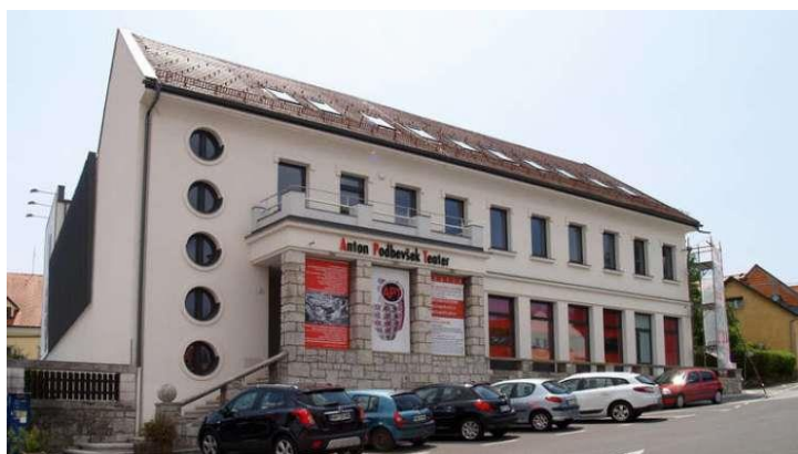
Figure 8 Anton Podbevšek teater