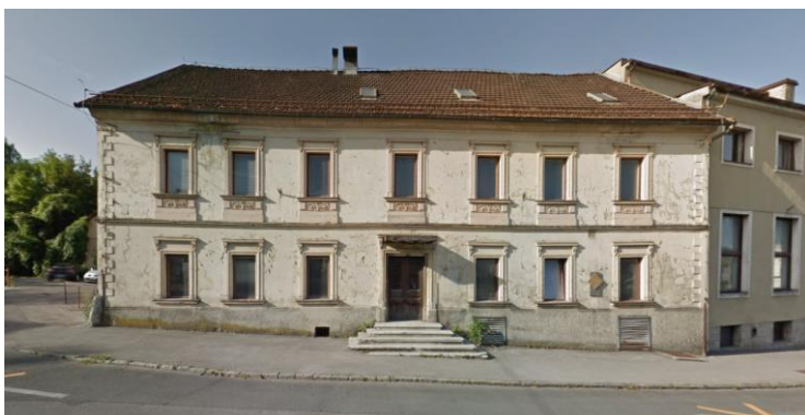
Figure 1 hiša novomeške pomladi