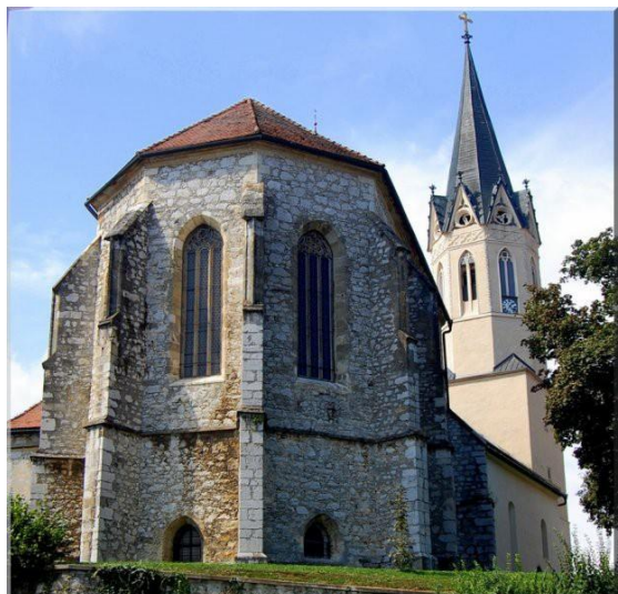
Figure 13 Kapiteljska stolna cerkev sv. Nikolaja