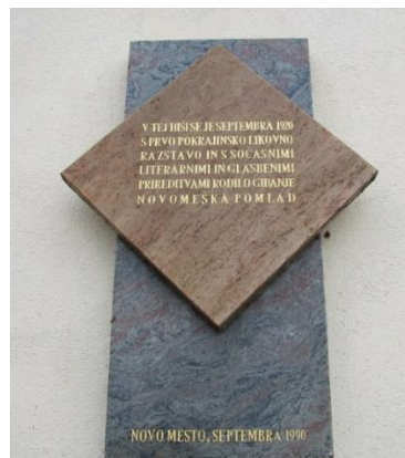
Figure 2 plošča na hiši