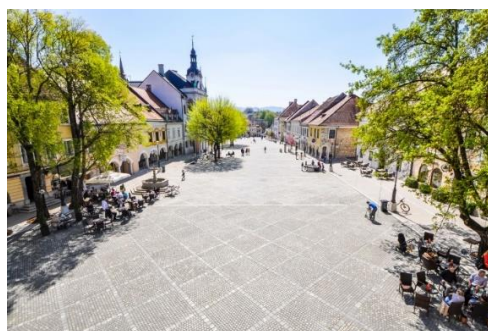
Figure 4 Glavni trg