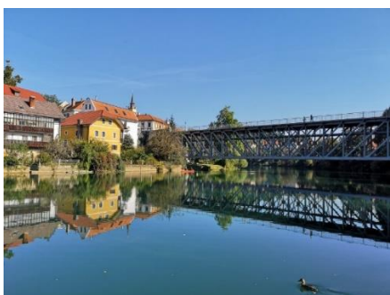
Figure 3 Kandiski most