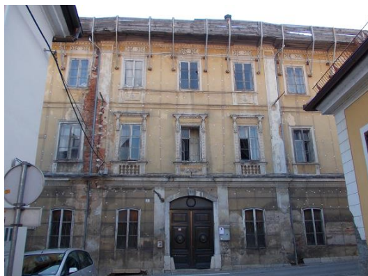
Figure 9 Narodni dom