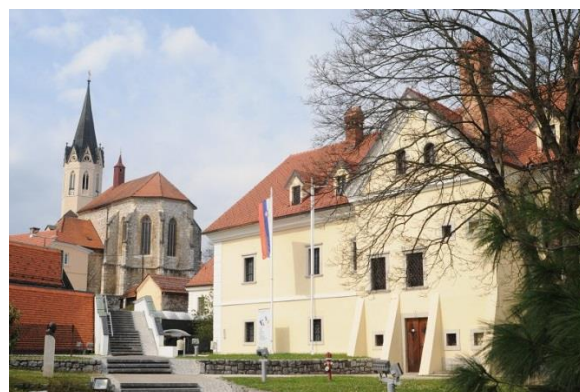
Figure 12 Dolenjski muzej