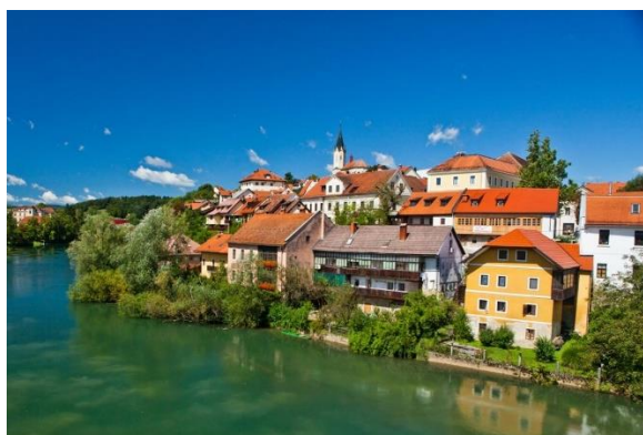
Figure 11 Breg